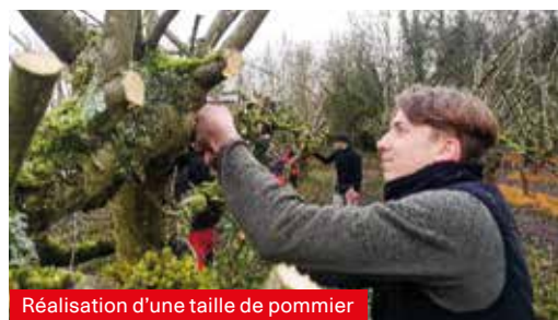
Réalisation d'une taille de pommier

* Filières bac pro Aménagements Paysagers, bac pro Forêt, BTS Gestion et Protection de la Nature