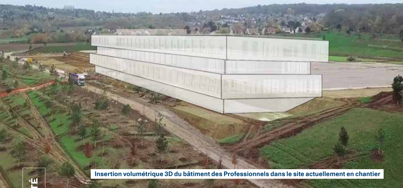
Insertion volumétrique 3D du bâtiment des Professionnels dans le site actuellement en chantier