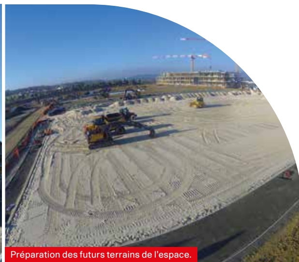
Préparation des futurs terrains de l'espace.