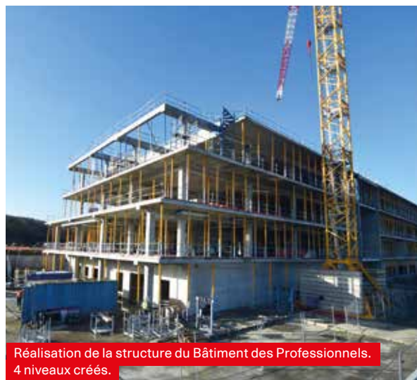
Réalisation de la structure du Bâtiment des Professionnels. 4 niveaux créés.