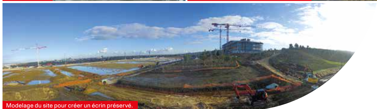
Modelage du site pour créer un écrin préservé.